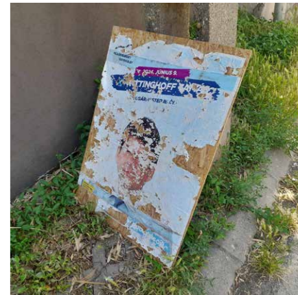
A választási plakátokat július 9-ig kell eltüntetni

Mikor kézbe veszik ezt az újságot, egy hónap telt el a június 9-i önkormányzati választások óta, így olvasóink többsége már értesült az eredményekről. Hiszen online mi magunk is folyamatosan tudósítottunk róla. Eszerint 2024. október 1-től az új képviselőtestület tagjai: