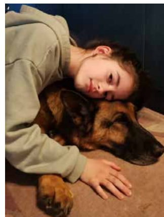
10. A képen Julcsi unokám látható, a Fajtamentéstől örökbefogadott Neo kutyámmal. Nagymama

Gyerekmosoly-fotópályázatunk első fordulója szeptember 26-án éjfélkor lezárult, és végül közel száz, aranyosabbnál aranyosabb kép érkezett. Bár nyáron, amikor ezt a lehetőséget meghirdettük, lassan indult el az érdeklődés, az elmúlt hetekben felgyorsult a folyamat, így még két perccel zárás előtt is töltöttek fel olyan fotót, amelyek be is került a három tagú zsűri által kiválasztott első tízbe. A szempontok: ötletesség, kisugárzás, esztétika, összbenyomás. M. Nagy Péter fotográfus, újságíró, művelődésszervező saját bevallása szerint elsősorban a képek kivitelezését nézte, illetve magát a kompozíciót. Mészáros Erzsébet festőművész, ifjúsági tábort vezetője és Borhegyi Éva a Budaörsi Napló főmunkatársa pedig ezek mellett a játékoságot, így a műtermi vagy arra hajazó fotók szóba se jöhettek. A második fordulóban önöknek kellett választaniuk a zsűri által kiemelt legjobbak közül. A szavazás október 10-ig tartott (ez már lapzártánk utáni időpont), amikor összesítjük az eredményt és október 12-én szerdán tervezzük a díjátadást a Hollósy Cukrászdában .