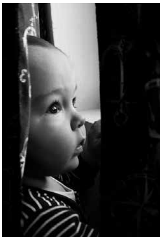
3. Bors reggeli rácsodálkozása az új napra.