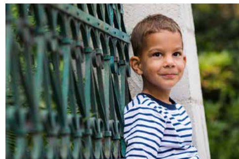
9. Milán Budaörsön a Templom téren.