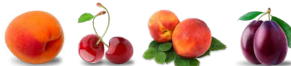
Kajsziarack Meggy Őszibarack Szilva

Befőzni vagy frissen, nagyobb mennyiségben is!