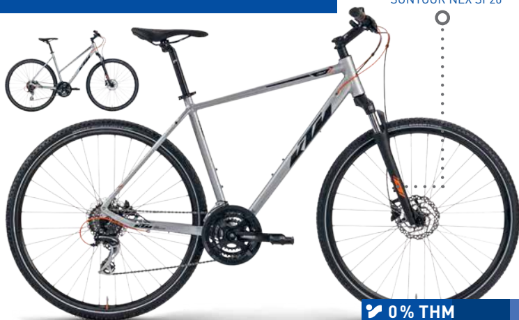
VILLA: SUNTOUR NEX SF20

Érvényes az áruházban megjelölt termékekre. Az IS Sport Bt., az INTERSPORT HU Kft. és az SPG Sportcikk Kft. a Cofidis Magyarországi Fióktelepének hitelközvetítőjeként jár el.